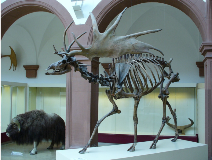
Un fossile de mégalocéros

Dans la vision d'Eimer, la sélection naturelle aurait encore un rôle mais ce serait uniquement de finir par éliminer tout organisme qui s'est développé dans des directions nuisibles . Ici, la sélection naturelle agit seulement en éliminant les organismes qui ne fonctionnent pas, plutôt qu'en créant l'adaptation.