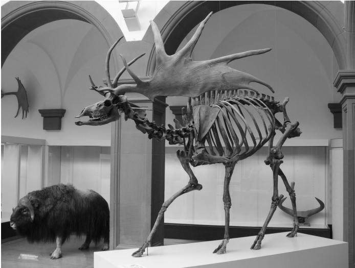
Un fossile de mégalocéros

Dans la vision d'Eimer, la sélection naturelle aurait encore un rôle mais ce serait uniquement de finir par éliminer tout organisme qui s'est développé dans des directions nuisibles . Ici, la sélection naturelle agit seulement en éliminant les organismes qui ne fonctionnent pas, plutôt qu'en créant l'adaptation.