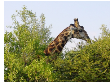
Une girafe déguste des feuilles très haut placées, Parc national Kruger, Afrique du Sud

Pourtant, il se trouve que l'évolution ne fonctionne pas comme ça (ou du moins presque jamais comme ça, nous y reviendrons) mais ce type de malentendu sur le processus évolutif est un des plus anciens et des plus répandus. Pendant plus d'un siècle, beaucoup de scientifiques de premier plan avaient la conviction que, pour décrire le problème à leur manière, les caractères acquis sont hérités , c'est-à-dire que les caractères développés par les organismes au cours de leur vie (comme un cou allongé ou de gros biceps) seront transmis à leur descendance. Darwin disait même que ce qu'il appelait « les effets de l'usage et du non-usage », c'est-à-dire la manière dont l'utilisation d'un organe ou le non-recours à un autre organe pouvaient affecter les modalités de transmission des caractères des parents à leurs descendants, étaient un facteur important dans les cas comme la disparition des yeux chez les espèces vivant dans des grottes.