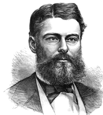
Edward Drinker Cope, gravure de 1881, publiée dans Popular Science Monthly

En plus de tout cela, Cope était un éminent défenseur du néo-lamarckisme. Pour lui, cette approche permettait de comprendre une autre caractéristique des fossiles que celle qui préoccupait Hyatt. Selon ses propres termes :