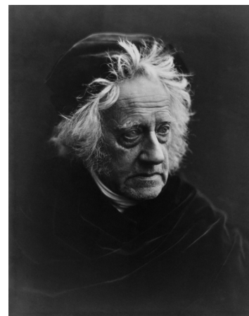
John Herschel, portrait par la célèbre photographe Julia Margaret Cameron

Changeons de perspective et penchons-nous sur la réaction générale de Herschel à la théorie de Darwin. Pour Herschel, il y a deux modes de fonctionnement possibles des changements dans le monde naturel, soit ils sont dirigés par une entité divine soit ils fonctionnent selon les lois de la nature, qui génèrent ses « causes véritables ». La sélection naturelle pourrait , à son avis, être une cause véritable. Mais pour avancer cet argument, il nous faudrait démontrer deux choses qui étaient hors de la portée de Darwin en 1859. Primo, il nous faudrait montrer que de nombreux changements survenus dans une espèce peuvent s'expliquer par la sélection naturelle. Et secundo, il nous faudrait comprendre la loi de variation, pour qu'il soit certain que la variation nécessaire à la production du nouvel organisme serait opérante au bon moment au bon endroit.